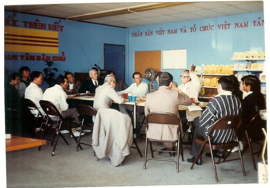
Prime Minister Dao open Office to serve the community at 12812 Brookhurst Street, Garden Grove, California.

Thủ Tướng Đào và các chiến hữu xây dựng Thánh Miếu và Tự Nghĩa Đài để tôn kính Chiến Sĩ hy sinh và Đồng Bào thâm tử vì lý tưởng Tự Do.