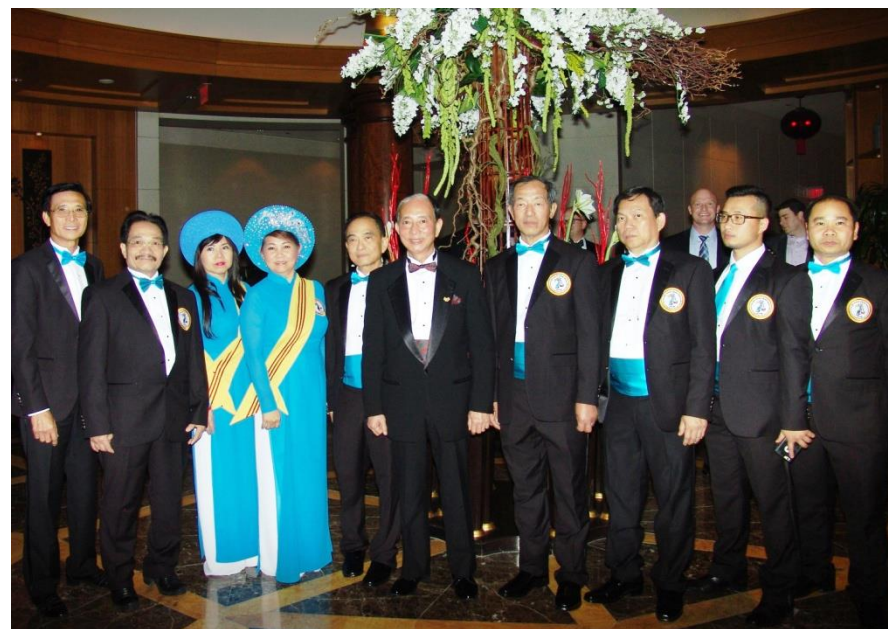
Prime Minister Dao and delegation attended the meeting with the US National Security Council at Wasington DC on Jan 19, 2017.

He escaped from the prison in 1979 and acted as a captain to sail a small ship carrying 524 refugees to Pulau Tangah Island, Malaysia.