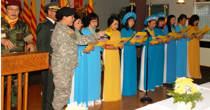
The Minnesota delegation welcomes Prime Minister Quan Minh Dao on 23 September 2017.

Phái đoàn CPQGVNLT tại Minnesota tiếp đón Thủ Tướng Đào Minh Quân công du ngày 23.9.2017.