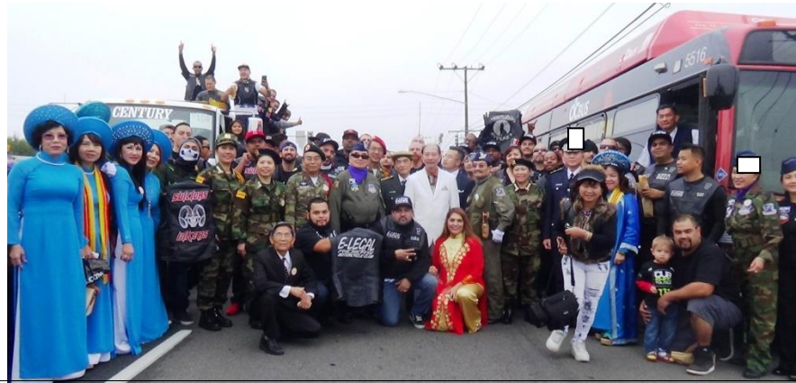
Prime Minister Quan Minh Dao and associates prepare 2016 Tet paraded on the Bolsa, the city of Westminster, California. Thủ Tướng Đào Minh Quân và các cộng sự viên chuẩn bị diễn hành trên đại lộ Bolsa, thành phố Westminster vào dịp Tết 2016.